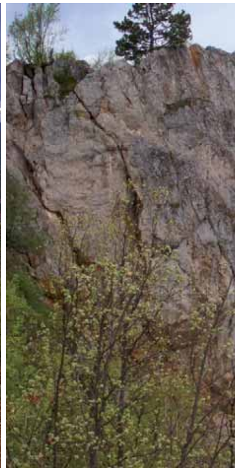
Панорама Сочанице / Брдо Сокољача изнад манастира Panoramic View of the Socanica Monastery / The Sokoljaca Hill above the Monastery