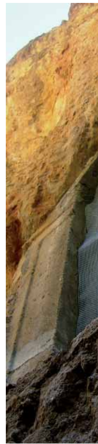
Пећина испод олтара The cave under the altar