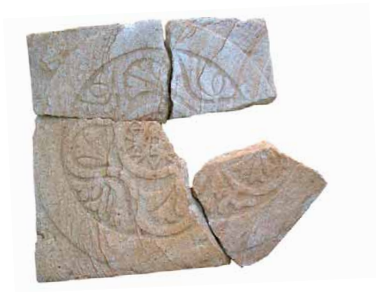
Розета нађена приликом ископавања пролаза у пећину The Rosetta stone found during the cave excavations

Later on, in that same place, the church of the Blessed Virgin Mary was built, followed by the present church of St. John the Baptist which was erected in the 19th century.