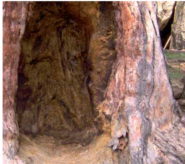
Дуб у бору The dent in the pine

During the Serbian -Turkish war, from 1876. to 1878, Turkish soldiers had gnarled inside the tree and used its tinder to make fire. The dents are still visible on the tree.