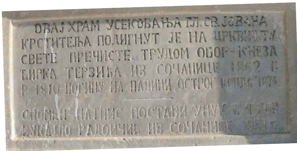
Ктиторска плоча уграђена код улаза у цркву

The Founder's plaque, carved in the wall, next to the church entrance