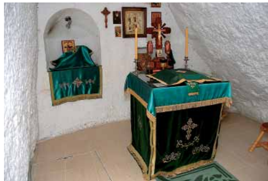
Унутрашњост храма и олтарски део у стени The holy church interior and the altar in the rock