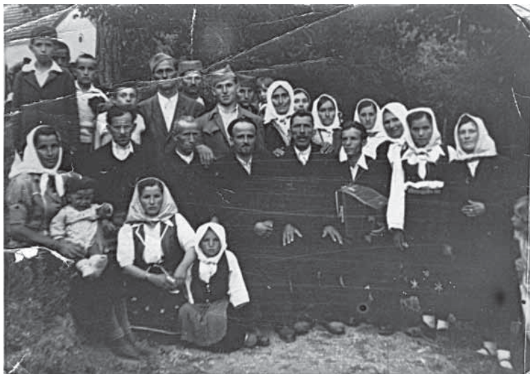
Парохијани из Сочанице окупљени око свештеника The parishioners gathered around the priest