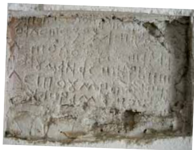
Надгробне плоче уграђене у цркву