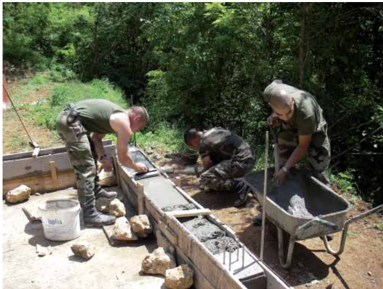
Војници КФОР-а приликом изградње пчеларске радионице The KFOR troops while building the apiary